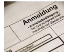
Meldebestätigung der Eltern des zuständigen Einwohnermeldeamtes über den Zuzug nach Deutschland**