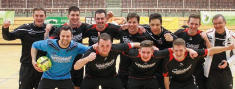
Die SG Rotation Leipzig 1950 ist als Titelverteidiger für die Endrunde am 3. Februar 2018 gesetzt.