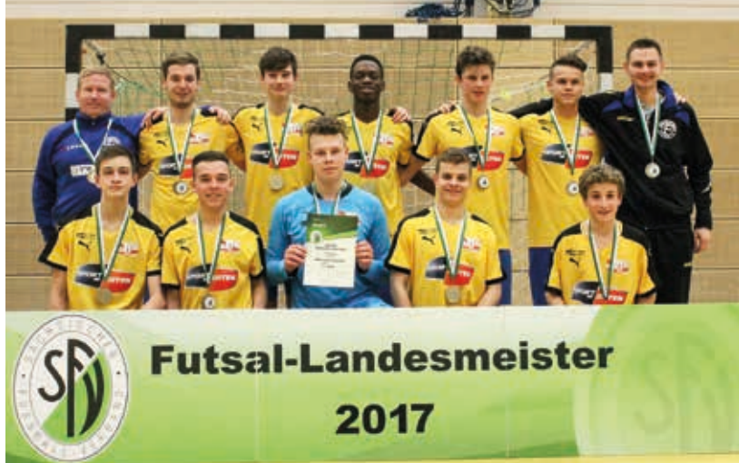
Der VfB Fortuna Chemnitz gewann die Futsal-Krone 2017. In diesem Jahr sind die Chemnitzer nicht dabei.