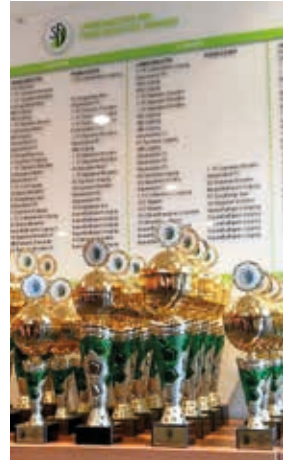
SFV-Futsal-Landesmeisterschaften Junior – 20 Turniere, 128 Mannschaften, 360 Spiele und 4 Landesmeister.

Die sächsischen Landesmeister vertreten den SFV bei den NOFV-Futsal-Meisterschaften. Der Regionalverband spielt in jeder Altersklasse einen NOFV-Meister aus. Die Sieger der NOFV-Wettbewerbe sind wiederum für die DFB-Meisterschaften qualifiziert. Neben den etablierten Turnieren für die B- und C-Junior, sucht der DFB erstmals auch einen A-Junior-Futsal-Meister.