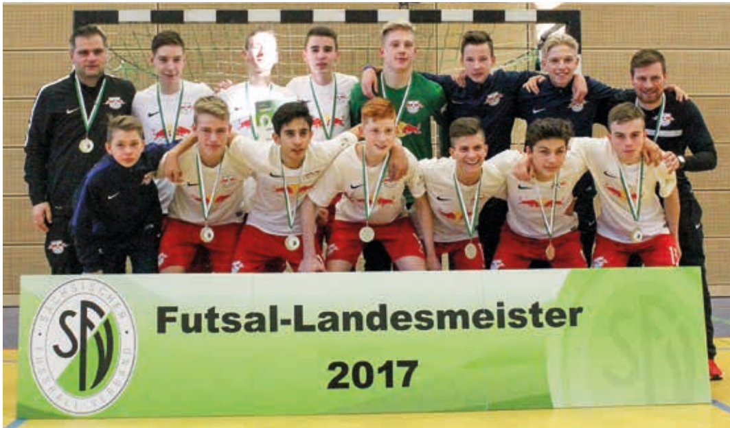
Stammgäste auf dem Siebertreppchen der C-Junioren: RB Leipzig In diesem Jahr haben die Jungbullen die Chance auf den fünften Titel in Folge.

Im Gegensatz zum Vorjahr wird es diesmal auch bei den C-Junioren vier anstatt fünf Regionalmeisterschaften geben. Aus der Regionalliga der C-Junioren wird auch die SG Dynamo Dresden wieder eine Mannschaft an den Start bringen. Im letzten Jahr scheiterten die Dynamos im Halbfinale an der SG Rotation Leipzig. Am 27. Januar 2018 spielen die besten acht C-Junioren Mannschaften in Borna ihren Hallenmeister aus. Der Landesmeister fährt am 25. Februar 2018 nach Gera zur NOFV-Futsal-Meisterschaft.