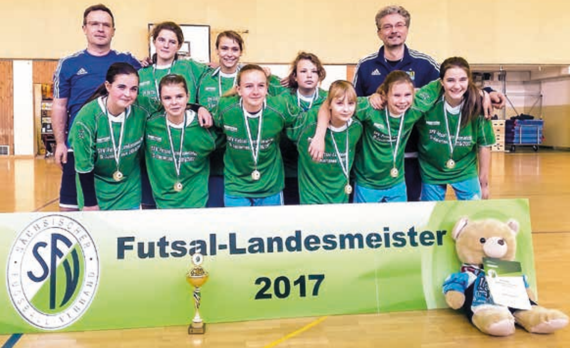
Titelverteidiger sind die Mädchen vom Chemnitzer FC.