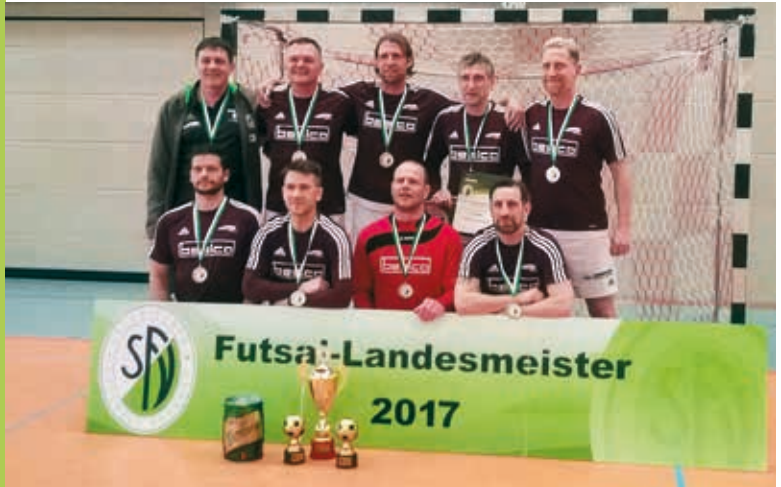
Die U 40-Herren Landesmeister 2017.

Der Ausschuss für Breitensport hat selbstverständlich auch in diesem Jahr seine Turnierreihe initiiert und bietet so den älteren Herren die Möglichkeit zum Fußball unter dem Hallendach. Dabei zeigt sich die positiv Entwicklung des Breitenfußballs in Sachsen. Denn im Vergleich zur letzten Hallensaison sind in diesem Jahr zwei neue Wettbewerbe hinzugekommen. So werden die Turniere der Werkstätten für behinderte Menschen und der Ü 70-Herren das erste Mal ausgetragen.