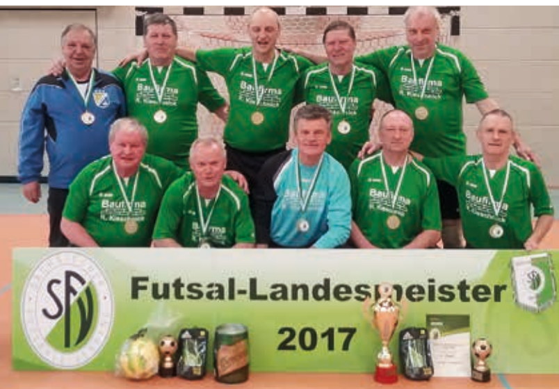
Bemerkenswert ist die Leistung der über 60-jährigen. In diesem Jahr feiern sogar die Ü 70-Senioren ihre Premiere.

Nichts Neues für die Mannschaften sind die Futsal-Regeln für alle Wettbewerbe. Den Auftakt im Breitenfußball machen die Ü 40 Herren am 21. Januar 2018 und bis auf das Turnier der Werkstätten für behinderte Menschen werden alle Turniere in Wilsdruff ausgetragen. Eine weitere Motivation für die Ü 40- und Ü 50-Herren sind die NOFV-Futsal-Meisterschaften in Sandersdorf, die am 10. und 11. März 2018 stattfinden. Hier treffen die sächsischen Landesmeister auf die Vertreter der anderen Landesverbände.