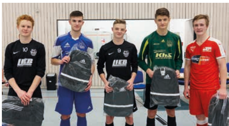
Das All-Star-Team der Endrunde 2017.