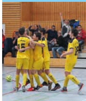
Der VFC Plauen jubelt über den Einzug in die Endrunde 2017. Auch dieses Jahr sind die Vogtländer wieder dabei.