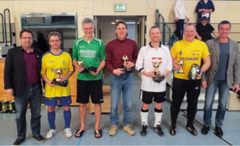
Traditionell wird bei den Turnieren ein All-Star-Team gewählt. So wie hier bei den Ü 50-igern im letzten Jahr.

Nichts Neues für die Mannschaften sind die Futsal-Regeln für alle Wettbewerbe. Den Auftakt im Breitenfußball machen die Ü 40 Herren am 21. Januar 2018 und bis auf das Turnier der Werkstätten für behinderte Menschen werden alle Turniere in Wilsdruff ausgetragen. Eine weitere Motivation für die Ü 40- und Ü 50-Herren sind die NOFV-Futsal-Meisterschaften in Sandersdorf, die am 10. und 11. März 2018 stattfinden. Hier treffen die sächsischen Landesmeister auf die Vertreter der anderen Landesverbände.