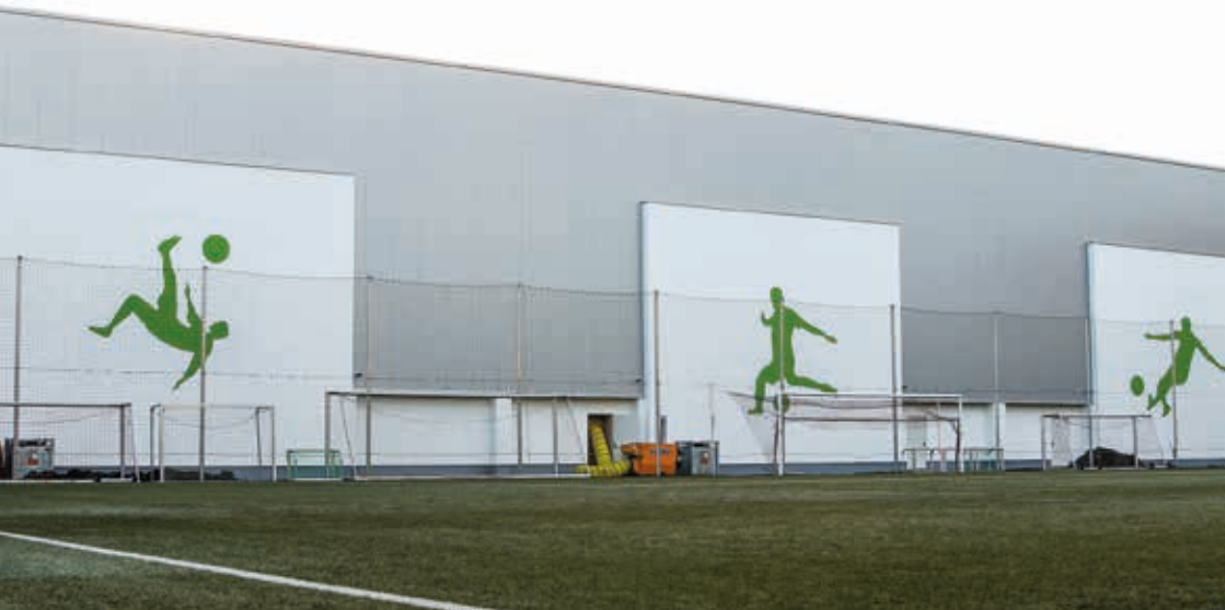
Die Fassade der SFV-Halle mit dem neuen Anstrich.